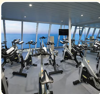
GIMNASIO DE LUJO