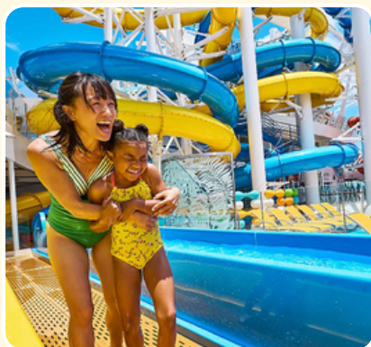
ACTIVIDADES PARA TODA LA FAMILIA