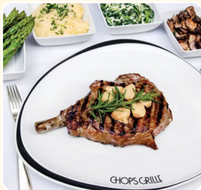
RESTAURANTES FINOS Y CASUALES

Harmony of the Seas ofrece una experiencia de crucero inolvidable con un diseño innovador y entretenimiento sin límites. Desde la emoción de Ultimate Abyss y FlowRider hasta espectáculos de clase mundial en el AquaTheater, cada día trae algo nuevo. Los huéspedes pueden relajarse en el tranquilo Central Park, disfrutar de una gastronomía inspirada en sabores de todo el mundo y descansar en una variedad de camarotes cuidadosamente diseñados, haciendo de Harmony of the Seas un equilibrio perfecto entre aventura, comodidad y estilo en alta mar.