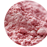
VITAMINE B12 (MÉTHYLCOBALAMINE)