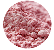
VITAMINE B12 (MÉTHYLCOBALAMINE)