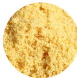
VITAMINE A (PALMITATE DE RÉTINYLE TOUT TRANS)